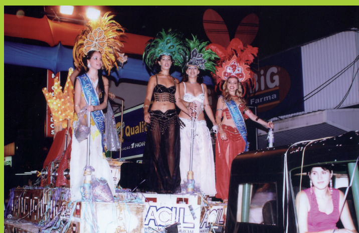
Carnaval 2003: a corte do Rei Momo no carro alegórico da ACIL