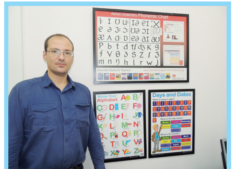
Durante as aulas, utilizar desenhos, expressões corporais e até mesmo objetos que exemplificam as palavras ensinadas são de extrema importância para o maior aprendizado dos alunos

Com a fluência em uma nova língua, Raimondo também lembra sobre a grande oportunidade que os brasileiros podem encontrar durante os grandes eventos que já foram e ainda vão ser realizados no