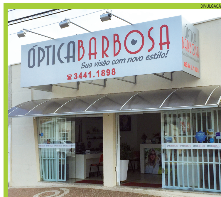
Com a mudança de nome, a Óptica Babosa foi reinaugurada mantendo os melhores produtos, além da qualidade e variedade

Em Limeira, a loja fica na Rua Bahia, 762, na Vila Cláudia (próximo a Santa Casa). Entre em contato pelo telefone (19) 3441-1868 ou visite o site www.opticabarbosa.com.br . Confira as novidades também na fanpage facebook.com/OpticaBarbosa e no Instagram, @opticabarbosa . O horário de funcionamento é de segunda a sexta-feira, das 8h30 às 18h, e aos sábados das 9h às 13h. "A Óptica Cidade agora é a Óptica Barbosa, apenas uma mudança de nome, mantendo as colaboradoras de excelente atendimento, produtos de qualidade e confiança de sempre. Venham conferir nosso trabalho, teremos prazer em atendê-los", convidam as sócias.