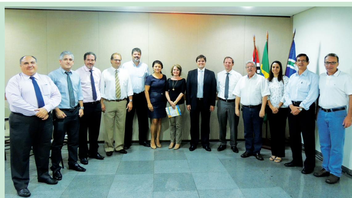
Diretores da ACIL entre os gerentes das agências do Banco do Brasil em Limeira